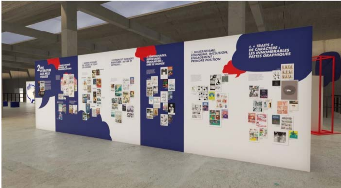
L'exposition itinérante du Village BD