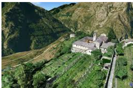
Le monastère de Saorge