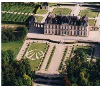
Le château de La Motte-Tilly