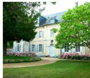
La maison de George Sand