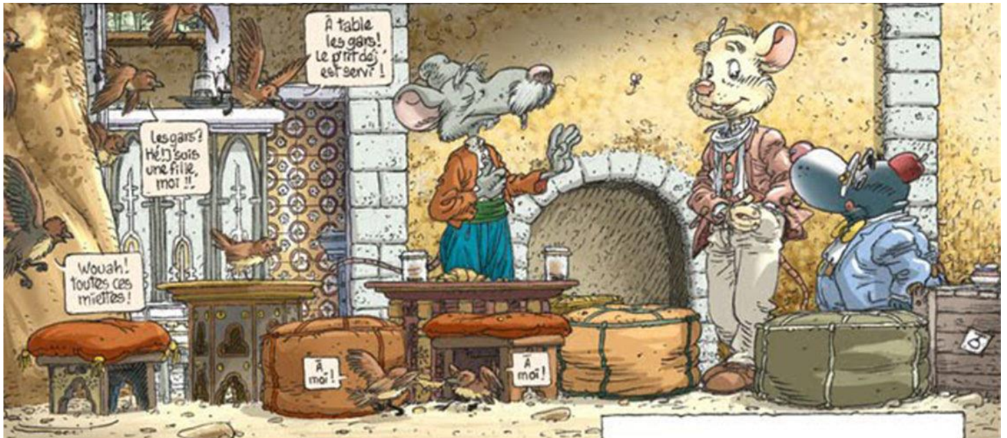
© Une planche, des coloristes/Quai des Bulles