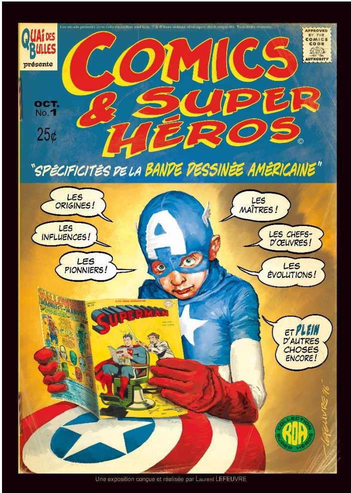
Une exposition conçue et réalisée par Laurent LEFEUVRE