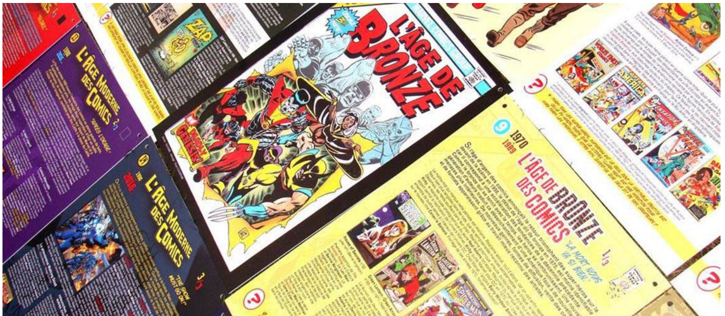
© Les spécificités du comics, Laurent Lefevre