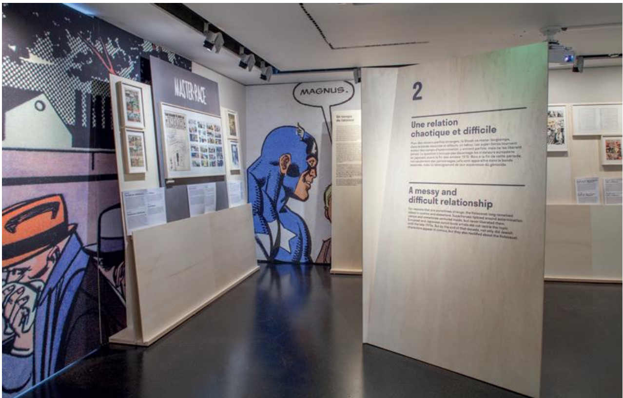
© Shoah et bande dessinée/Mémorial de la Shoah/Photo Julien Lelièvre