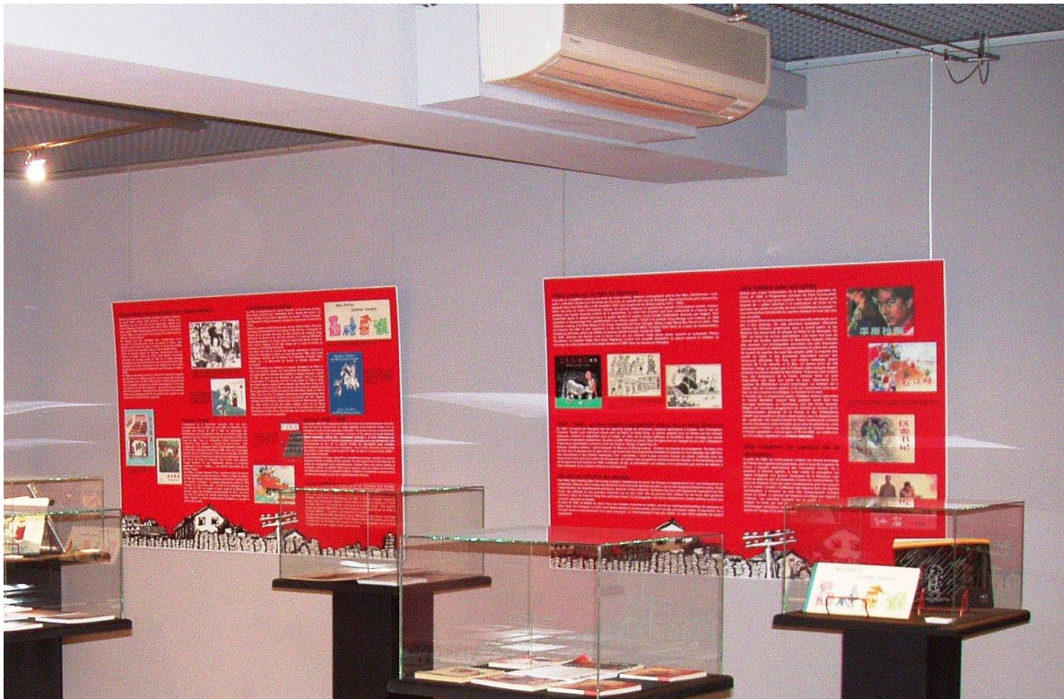
© Histoire de la BD chinoise/BD Boum